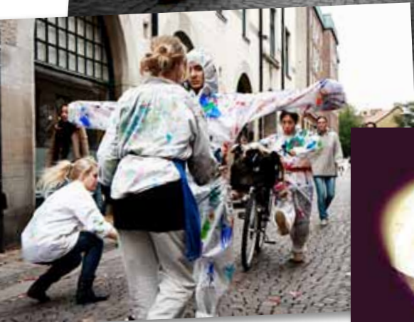
Affisch för Kulturnatten i Köpenhamn. ▶